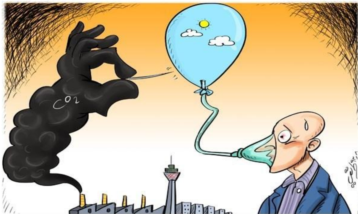
Cartoon : Javad Tarighi Akbarpor