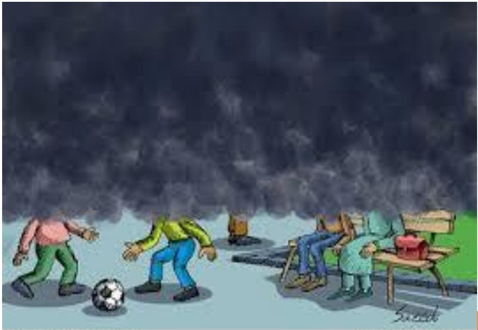
Cartoon : Saeed Sadeghi